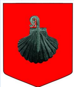
Asociación Amigos de la Colegiata de Roncesvalles